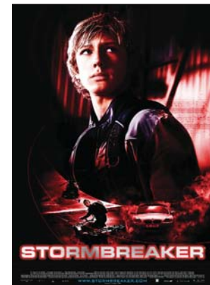
Førpremière kino: Stormbreaker