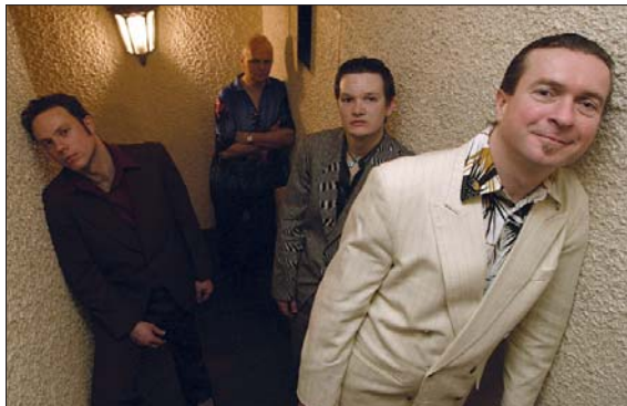
Good Time Charlie spelar opp til dans laurdag!