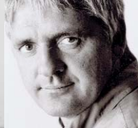
Kjell Ola Dahl