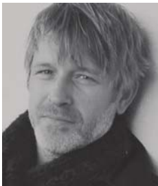
TROND ESPEN SEIM

Det blir sal av drikkevarer og krimsuppe. Gratis transport med buss frå Quality Førde Hotel klokka 19.00, med retur ein time etter programslutt. Privatbilar parkerer ved Indre Angedalen skule, og vi går samla derfrå i fakkeltog ca. kl. 19.30